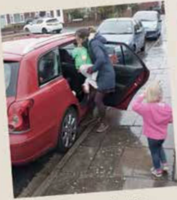
Bugün aile gerçek bir çiftliğe gidecek