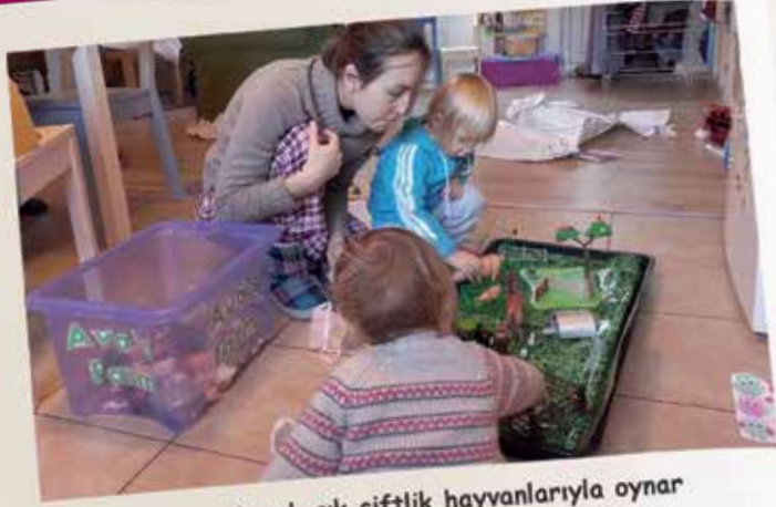
Lili ve Ava evde sık sık çiftlik hayvanlarıyla oynar